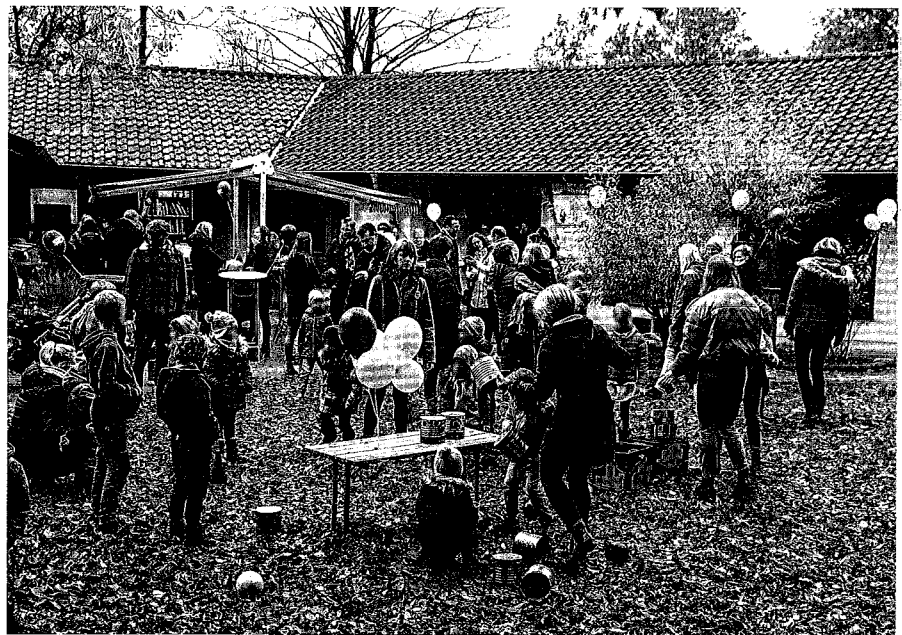
Die Jubiläumsfeier im Jahr 2021

In letzten Jahr feierte die Elterninitiative ihr 25-jähriges Jubiläum und ist als engagierter Akteur nicht mehr aus Klüt wegzudenken. Aktuell haben 78 Kinder ihren Platz in der Kita, davon 18 Kinder unter drei Jahren. Sie werden