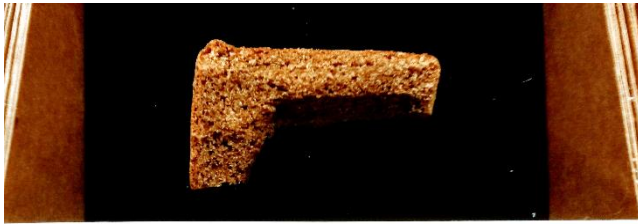
Exponat VVII-88-12: Konfiszierte Spielzeugwaffe, mittlere BAGE-Zeit